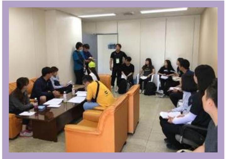
2019 장애인스포츠지도사 실기 구술.

8월 14일(금)로 예정되어 있던 2급 장애인스포츠지도사 실기·구술시험이 연기되었습니다. 연기된 날짜는 추후 국민체육진흥공단 및 연맹 홈페이지에 공지될 예정입니다.