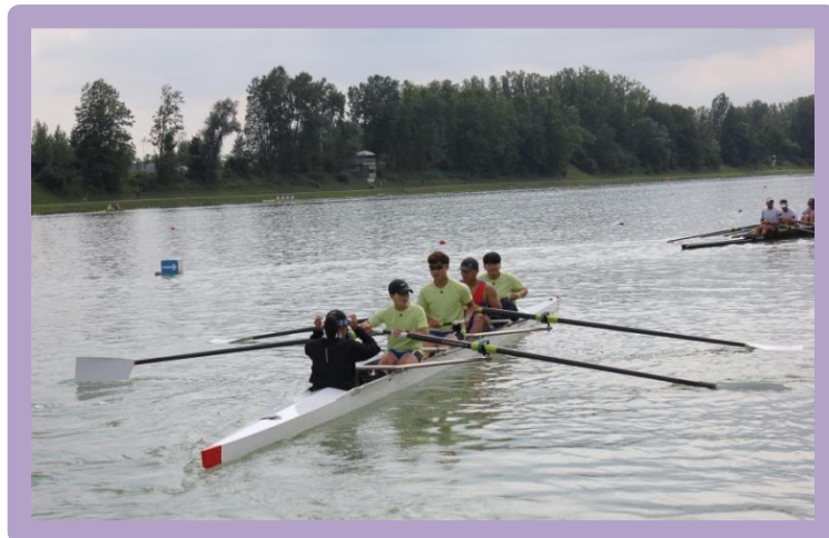
2019 세계조정선수권 대회 훈련

신종코로나바이러스(COVID-19)의 영향으로 인하여 중단 및 비대면 훈련으로 진행되어 왔던 2020년 국가대표 훈련이 7월 29일(수)부터 재개되었습니다. 훈련 일정은 코로나 19 상황에 따라 변경될 수 있습니다.